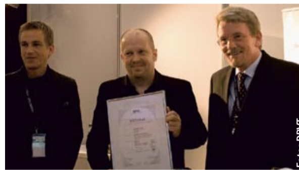
satis&amp;fy jetzt mit DPVT-Prüfsiegel