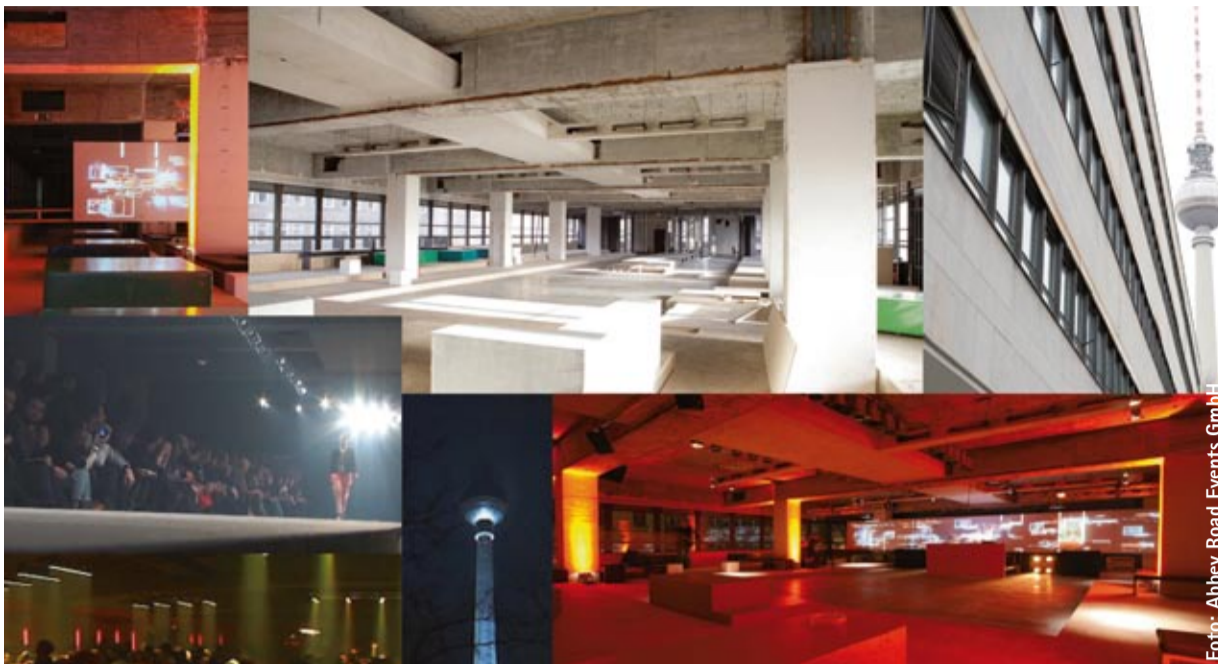
Der neue WMF-Club

In einem ehemaligen Fernmeldeamt in der Klosterstraße 44 hat er sich niedergelassen. Partygünstig gelegen zwischen Potsdamer Platz und Alexander Platz, wo die Tanz- und Feierwilligen allabendlich herumschwirren. Mit der neuen Unterkunft hat der Club bereits seine sechste Behausung bezogen. Außergewöhnlich waren sie alle: selbst der Untergrund, eine unterirdische Toilettenanlage auf dem Mauersstreifen, wurde für eine Zeit als Domizil genutzt. Jetzt also ein altes Fernmeldeamt. Der Stahlbeton-Skelettbau wurde in den 60er-Jahren für die Ostberliner Telefongesellschaft erbaut. Die WMF-Crew hat die zwei unteren Etagen zwar schnörkellos, kühl und sachlich gestalten lassen, dennoch erinnert in ihrem Inneren nichts mehr an die einstige Behörde. Die Clubräume im Parterre wie die 800 Quadratmeter große Eventfläche im ersten Stock präsentieren sich dem Publikum in klarem, gradlinigem Design. Seinen neuen Partner brachte der Club gleich mit in die Klosterstraße, und der heißt seit Mai ganz offiziell satis&fy. Neben dem gewöhnlichen außergewöhnlichen Clubbetrieb lassen sich auf der