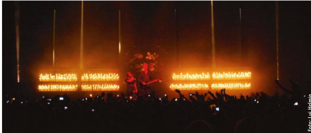
400 Kerzen für einen Song!