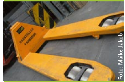
Viel benutzt, heiß geliebt, oft vermisst

Selbst taffe satis&fy-Warehouse-Members werden zu Poeten, beschreiben sie das Wesen ihres liebsten Arbeitskollegen: Des Hubwagens.