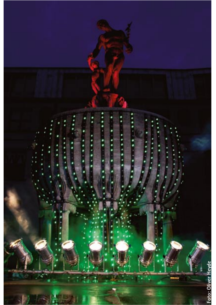
Kultursponsoring: CrossMediaNight, Hochschule für Gestaltung Offenbach