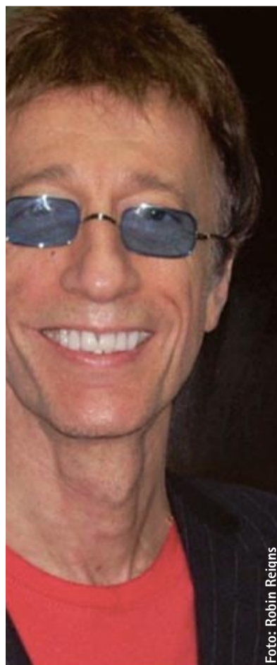
„Night Fever“ mit Robin Gibb

Schlaghosen, flatterige Hemden mit Blumenmuster, schulterlange Lockenpracht, dreistimmiger Harmoniegesang. Die Bee Gees – wissen Sie noch? Als „One Bee Gee Alone“ präsentierte Robin