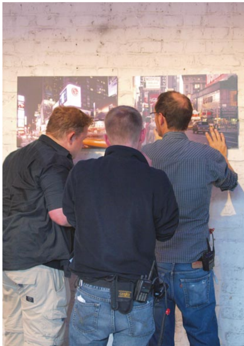
Undercover: s&f-Sondereinsatzkommando Gestaltung