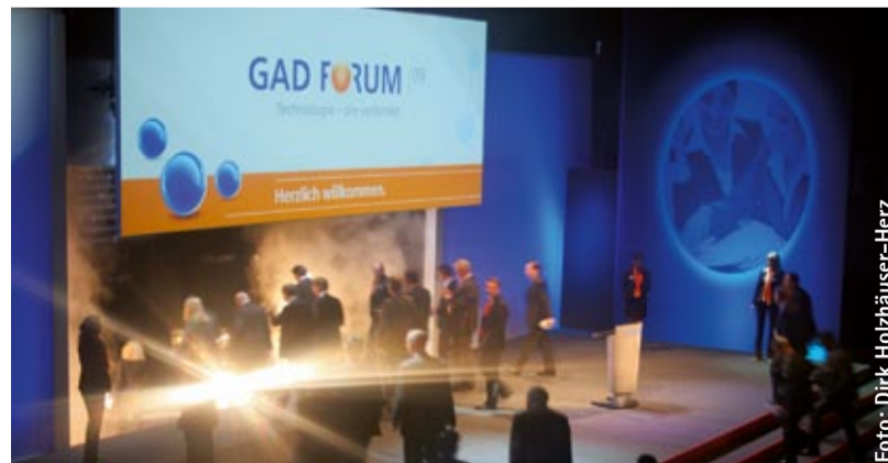
Das Tor zur Filiale der Zukunft

Die GAD eG, IT-Dienstleister, Rechenzentrum und Softwarehaus für 400 Geldinstitute, hatte vom 16. bis 19. Juni Kunden, Partner und Mitglieder nach Münster zum GAD FORUM 2009 eingeladen, der bedeutendsten Messe