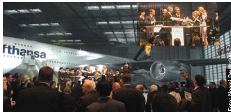
Riesenkranich „Frankfurt am Main“ feiert Coming Home

s&f inszeniert Inbetriebnahme des ersten A380 bei der Lufthansa