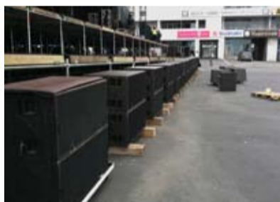
Es herrscht Ordnung hinter den Kulissen