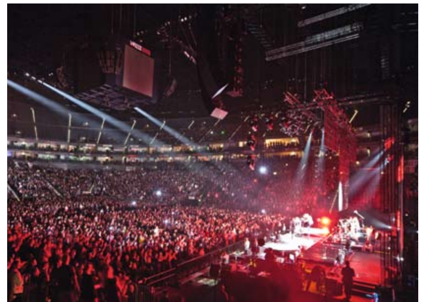
Begeisterte Fans, soweit das Auge reicht

den Technikern so keck in die Auslage blies, dass man wieder um den Auftritt bangen musste, laufen die Konzerte rund. Ein Hauch von Nostalgie schwingt in den Berichterstattungen immer mit; man kennt das von den Auftritten anderer Poplegenden. a-ha gibt alles, um dem Motto der Tour – Ending on a High Note – gerecht zu werden und der Fangemeinde ein letztes wunderbares a-ha-Erlebnis zu verschaffen. Ein souveränes Finale, wenn man es denn will. satis&fy tickt anders: Wenn alles gut läuft und am schönsten ist, machen wir gerade weiter. Weil Live-Entertainment nicht nur dem Frontman, sondern auch dem Technikerdienstleister im Hintergrund einfach Spaß macht. kw