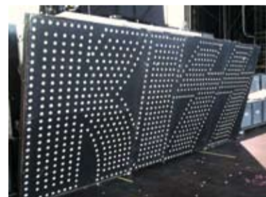
Alles, was Rang und Namen hat, war dabei

funktionieren und Spaß machen. Ich finde, dass gerade in diesem Jahr genau das der Fall war. Das Wetter war super, die Crew harmonisch und das Catering einfach nur lecker! Auch dieses Jahr schafften wir es wieder, dass die Festivalbesucher und vor allem die Künstler einen zufriedenen Eindruck machten.