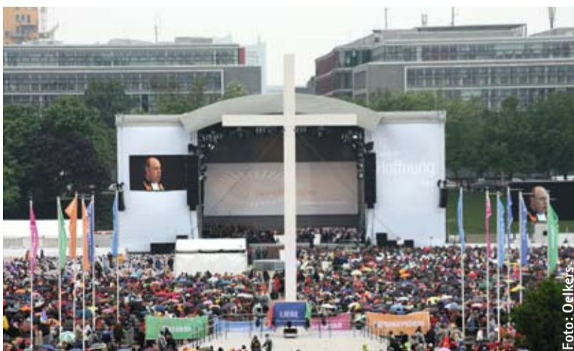
Segen im Regen

„Damit ihr Hoffnung habt“ – unter diesem Leitwort trafen sich im Mai circa 180.000 Christen zum 2. Ökumenischen Kirchentag in München, um gemeinsam zu diskutieren, zu singen, zu feiern.