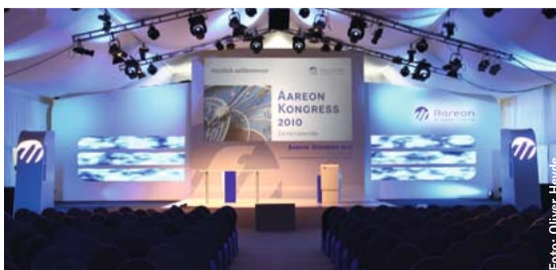
One-Stop-Solution im Kurpark

Im Tal 4 bis 6 Grad Außentemperatur, eine Woche lang Regen und Schnee auf den Anhöhen rundum – mitten im Mai! Das Wetter war dieses Mal gegen uns. Wichtiger aber war das Klima, genauer, das Arbeitsklima zwischen Aareon, der Agentur H&R communications und satis&fy. Das war von Beginn der Zusammenarbeit an reizvoll – also überaus ge-