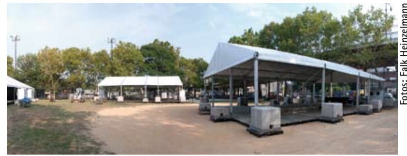
Welcome to America: klimatisierte Zeltbauten

Eine weitere technische Besonderheit des Harlem-Jobs: der open-air verlegte Court, dessen umfassende Nutzung trotz wettertechnischer Unwägbarkeiten nicht beeinträchtigt war. Dieses Hightech-Wunderwerk wurde auf dem vorhandenen Asphaltplatz verlegt, der zunächst mit Styrodur ausgeglichen wurde, um eine wirklich ebene Fläche zu erhalten. Dann erst konnten die circa 80kg schweren NBA-Bodenplattenelemente ausgelegt werden, für deren Anlieferung zwei LKWs nötig waren. Die Oberfläche wurde