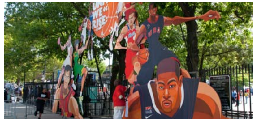
Diese Pappkameraden gab's auch in echt