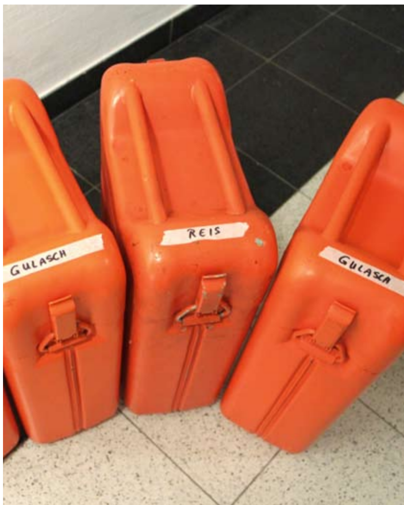
Crew-Catering ist schon was Feines...