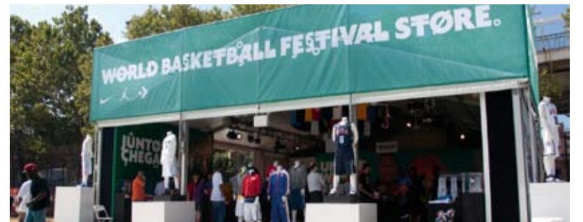
Auch beim Festival darf ein Store nicht fehlen