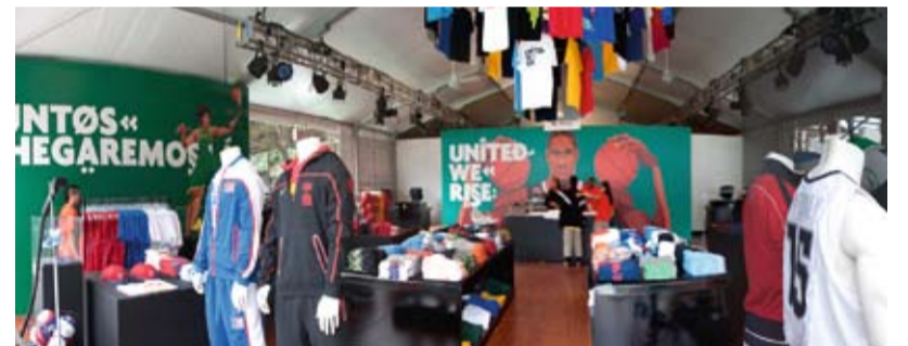
XS war hier nicht gefragt