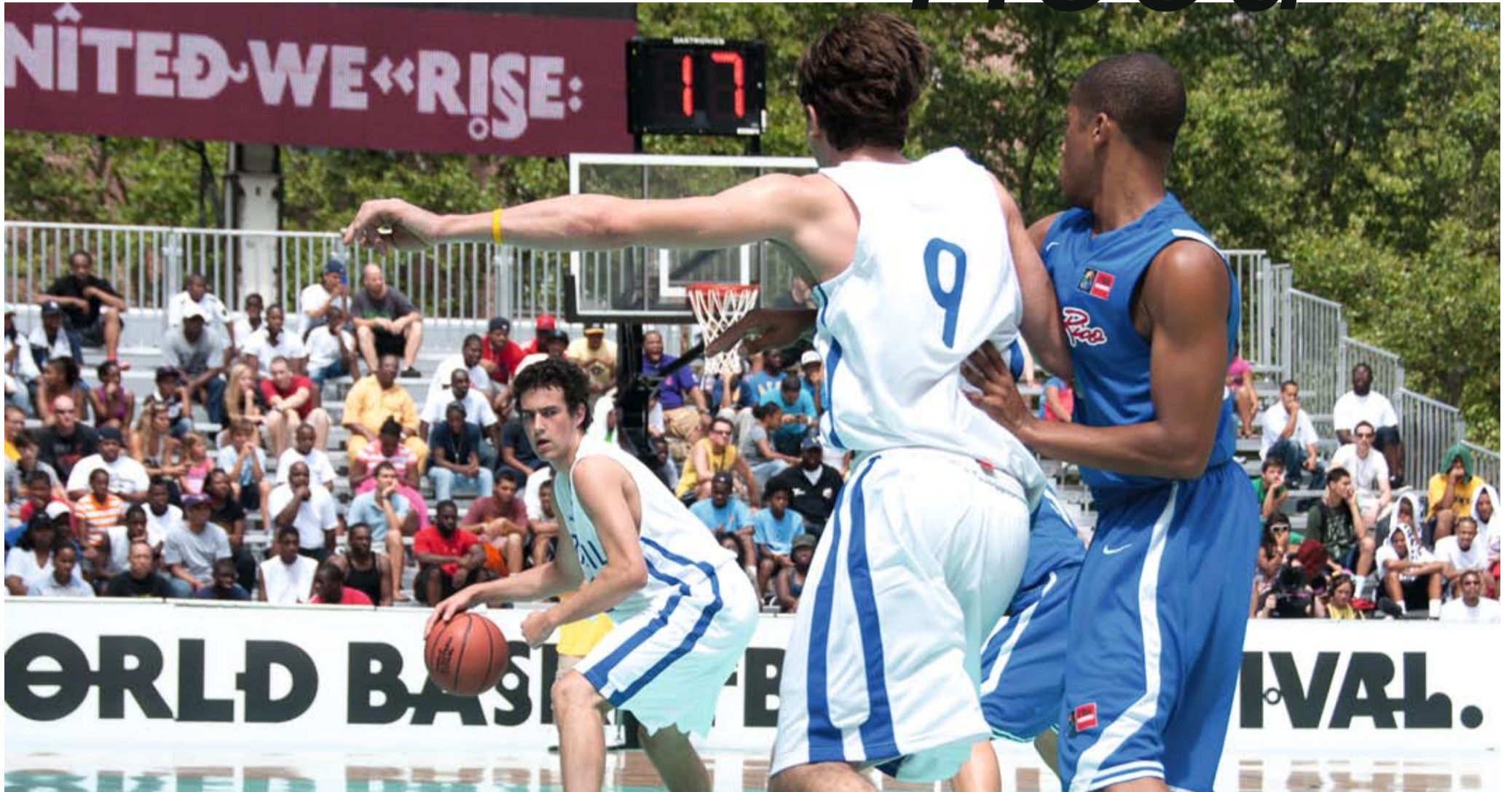
Für zwei Tage Treffpunkt der Basketball-Weltelite: der NBA-Court im Rucker Park

Für Nike U.S.A. in Harlem N.Y.C. in Sachen Basketball unterwegs