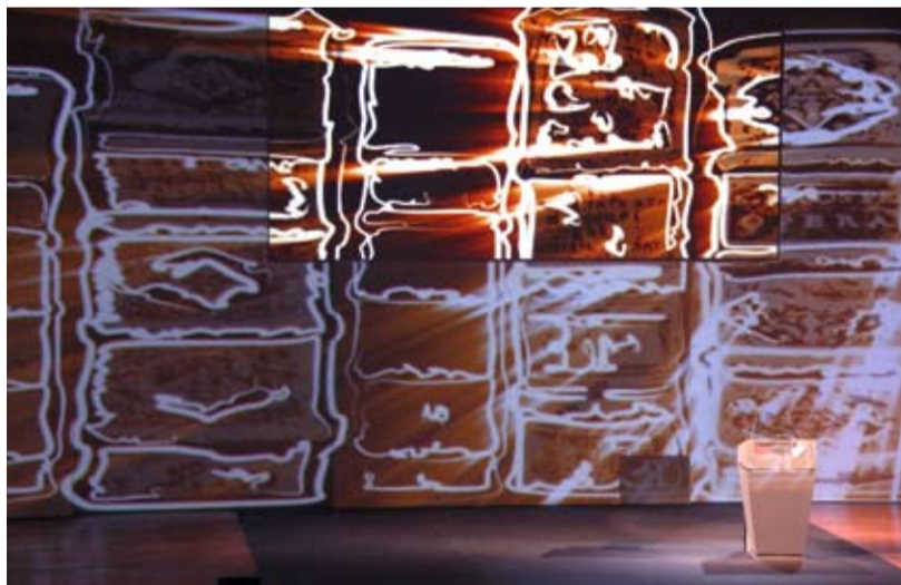
Die Magie der Bücher - 2010 visuell umgesetzt von satis&fy

Bücher geben oft einen tiefen Einblick in den Geist und die Seele der Menschen. Auch der Ehrengast des Abends, die argentinische Präsidentin Cristina Fernández de Kirchner , machte dies mit empathischen Worten deutlich.